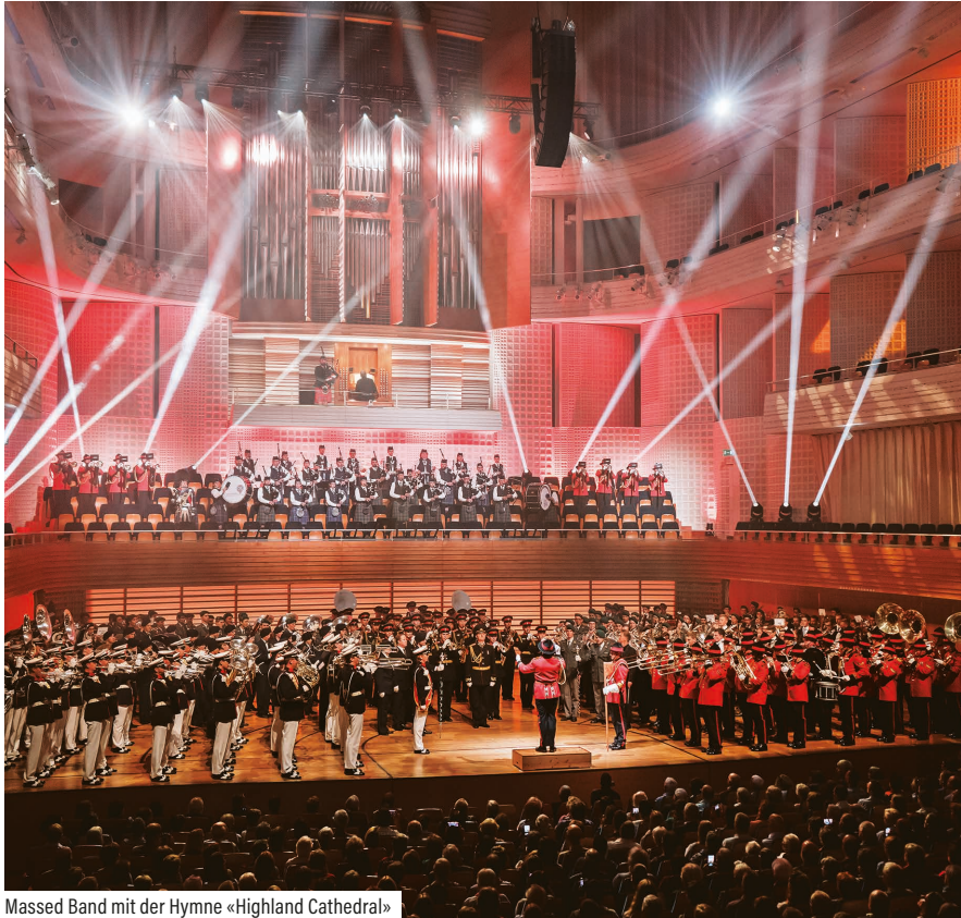
Massed Band mit der Hymne «Highland Cathedral»