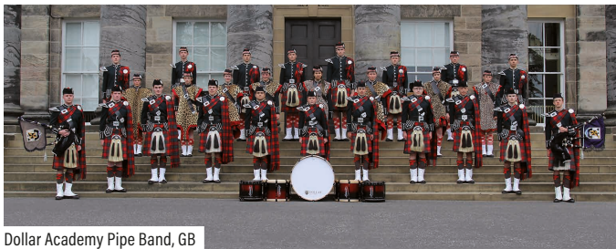
Dollar Academy Pipe Band, GB

Brass Fanfare Of The Swiss Armed Forces Central Band Schweiz The Band Of The Armed Forces of Malta Malta Show- & Marchingband AMIGO Leiden Niederlande Fascinating Drums Deutschland Ailsa Craig Highland Dancers Schottland Jugendmusik Kreuzlingen Schweiz Militärmusik Rekrutenspiel 16-2/2024 Schweiz Militärmusik Rekrutenspiel Drum Corps 16-2/2024 Schweiz Dollar Academy Pipe Band Schottland Matt Wilson Pipe Major & Director of Pipe Band, Schottland Christian Klemm SRF Musikwelle, Moderation