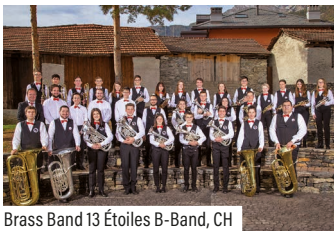
Brass Band 13 Étoiles B-Band, CH