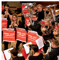
Besson Swiss Open Contest