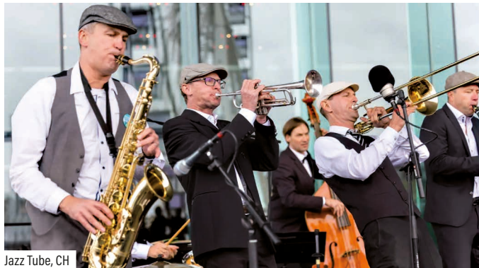
Jazz Tube, CH