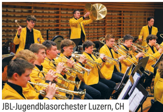
JBL-Jugendblasorchester Luzern, CH