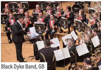
Black Dyke Band, GB