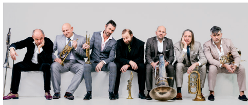
Mnozil Brass, AT