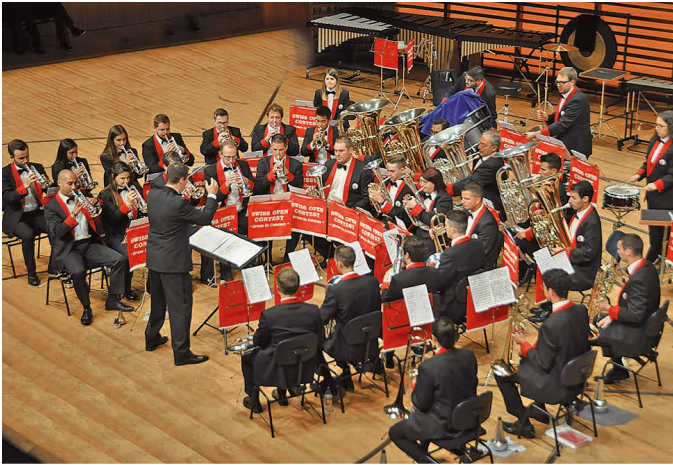
Brass Band 13 Étoiles – Besson Swiss Open Champion 2023