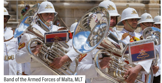
Band of the Armed Forces of Malta, MLT