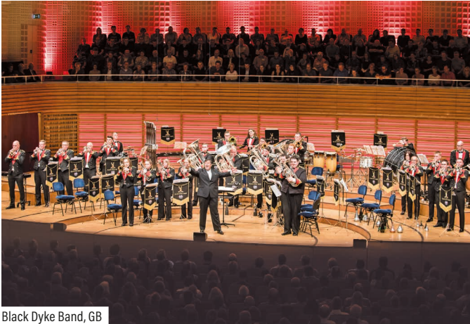
Black Dyke Band, GB