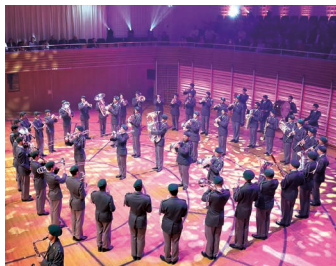
Militärmusik RS 16-2/2024, CH