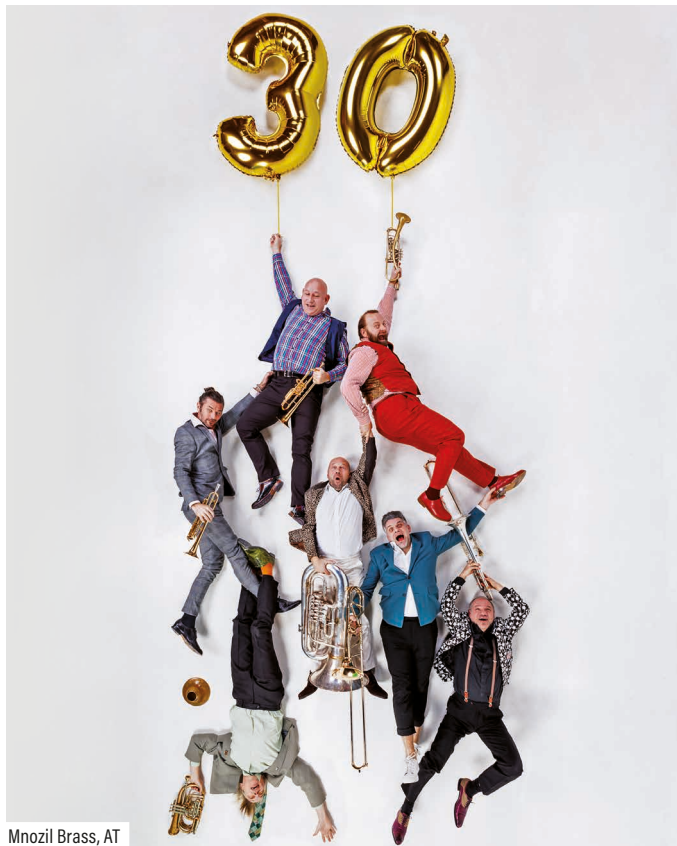
Mnozil Brass, AT