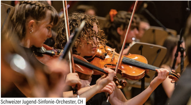
Schweizer Jugend-Sinfonie-Orchester, CH