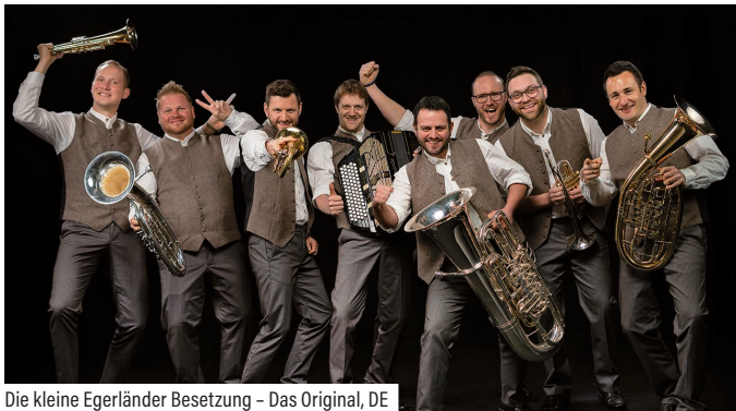
Die kleine Egerländer Besetzung – Das Original, DE