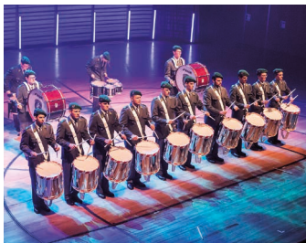
Militärmusik RS 16-2/2024 Drum Corps, CH