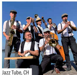
Jazz Tube, CH