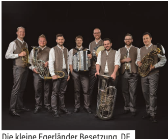
Die kleine Egerländer Besetzung, DE