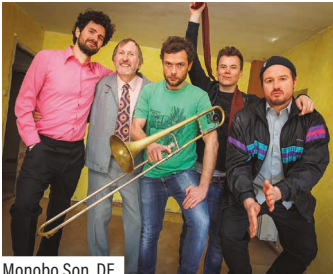
Monobo Son, DE