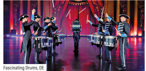
Fascinating Drums, DE