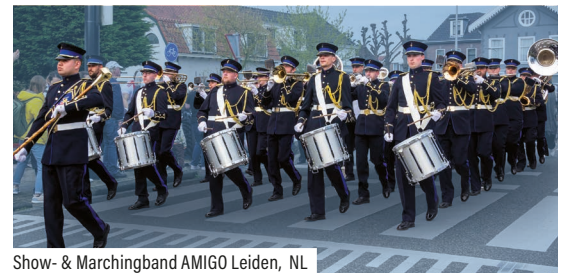
Show- & Marchingband AMIGO Leiden, NL