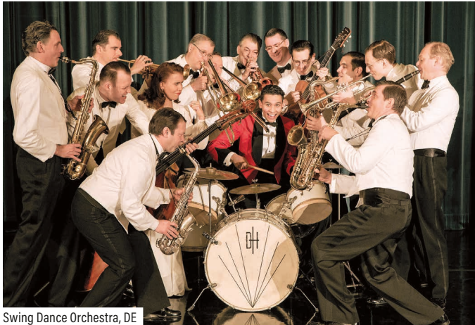
Swing Dance Orchestra, DE